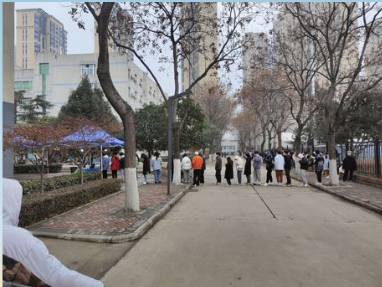
1月24日学校发车批次表